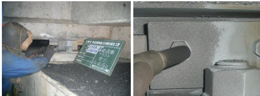
素地調整 ブラスト施工状況