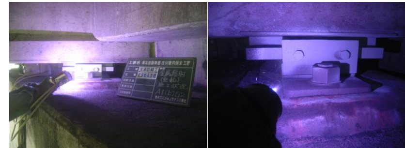
金属溶射 (亜鉛) 施工状況