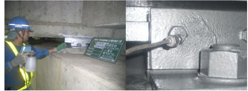
保護塗装施工状況